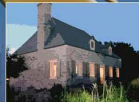
D'après une photo de Jacques Marois